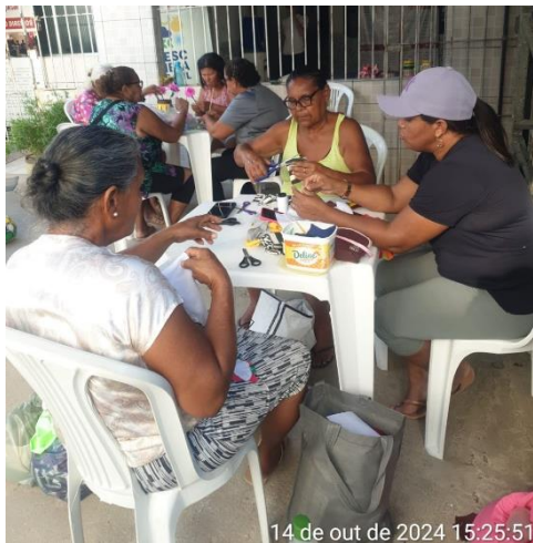
14 de out de 2024 15:25:51