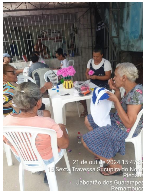
21 de out de 2024 15:47:39 15 Sexta Travessa Sucupira do Norte Piedade Jaboatão dos Guararapes Pernambuco