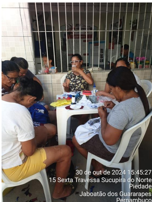
30 de out de 2024 15:45:27 15 Sexta Travessa Sucupira do Norte Piedade Jaboatão dos Guararapes Pernambuco