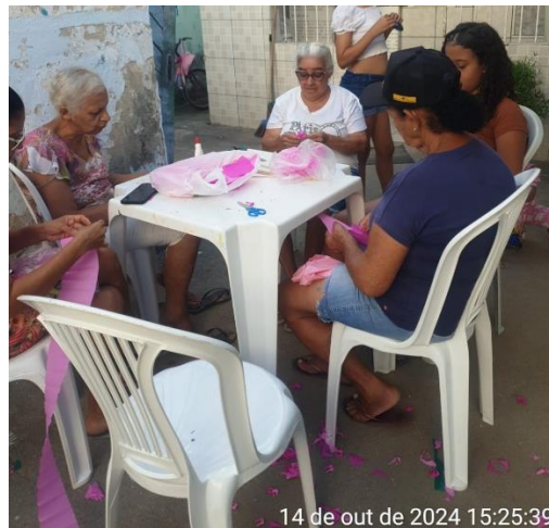
14 de out de 2024 15:25:39