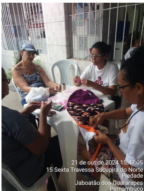
21 de out de 2024 15:47:05 15 Sexta Travessa Sucupira do Norte Piedade Jaboatão dos Guararapes Pernambuco