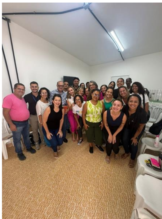
REUNIÃO DE REDE