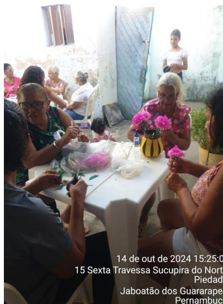
14 de out de 2024 15:25:01 15 Sexta Travessa Sucupira do Norte Piedade Jaboatão dos Guararapes Pernambuco