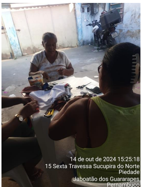
14 de out de 2024 15:25:18 15 Sexta Travessa Sucupira do Norte Piedade Jaboatão dos Guararapes Pernambuco