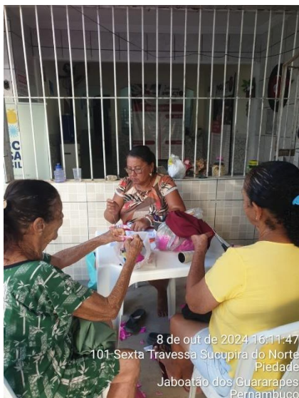
8 de out de 2024 16:11:47 101 Sexta Travessa Sucupira do Norte Piedade Jaboatão dos Guararapes Pernambuco