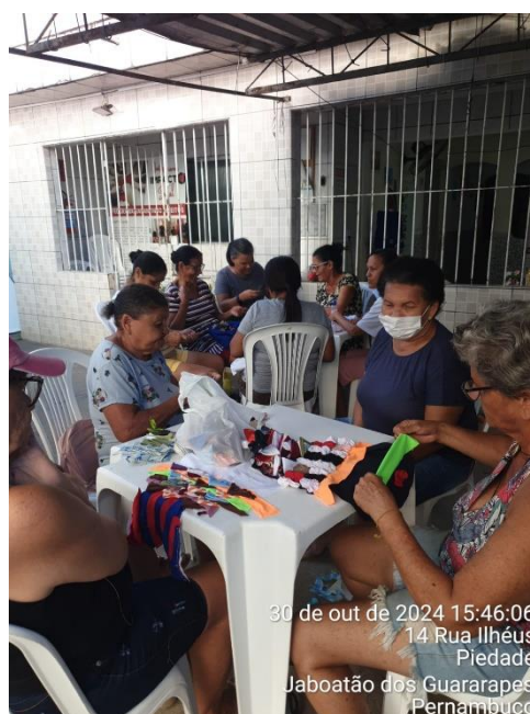
30 de out de 2024 15:46:06 14 Rua Ilhéus Piedade Jaboatão dos Guararapes Pernambuco