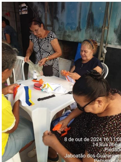
8 de out de 2024 16:11:08 14 Rua Ilhéus Piedade Jaboatão dos Guararapes Pernambuco