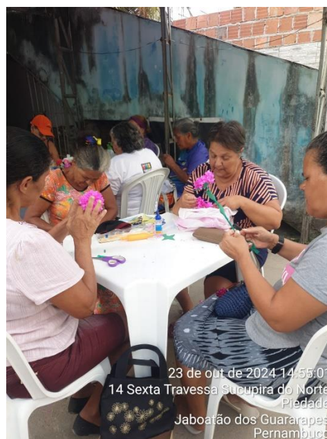
23 de out de 2024 14:55:01 14 Sexta Travessa Sucupira do Norte Piedade Jaboatão dos Guararapes Pernambuco