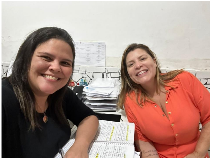
SUPERVISÃO: ESTUDO DE CASO DE IDOSA, ENCAMANHADA PARA ACOMPANHAMENTO PSICOLÓGICO NA UNIFG