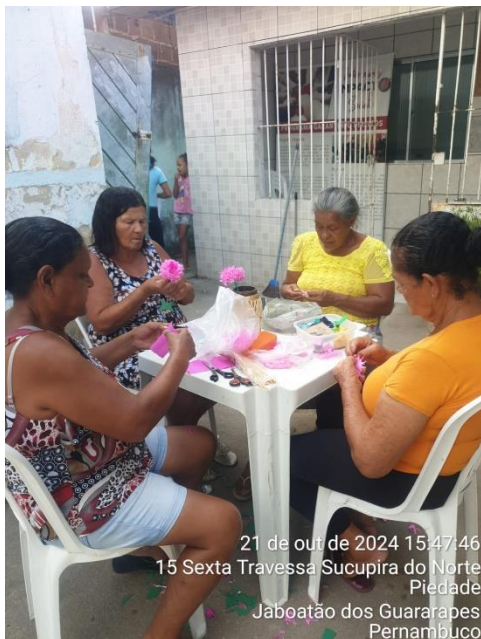
21 de out de 2024 15:47:46 15 Sexta Travessa Sucupira do Norte Piedade Jaboatão dos Guararapes Pernambuco