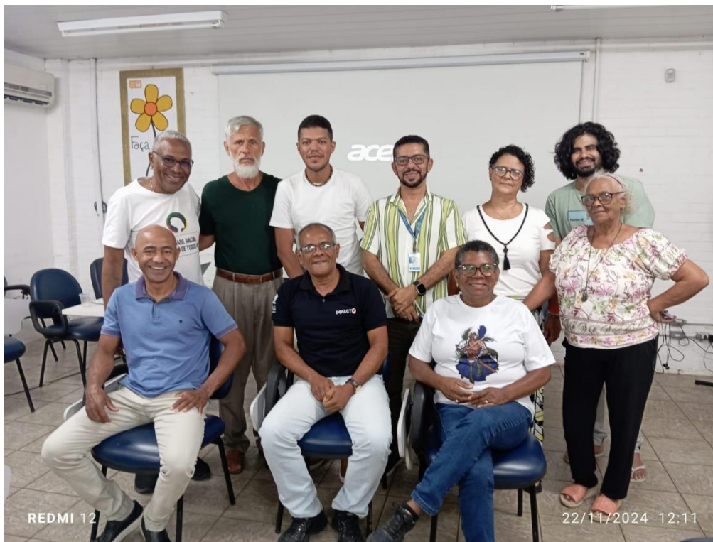
REUNIÃO DO CONSELHO MUNICIPAL DE PROTEÇÃO E IGUALDADE RACIAL