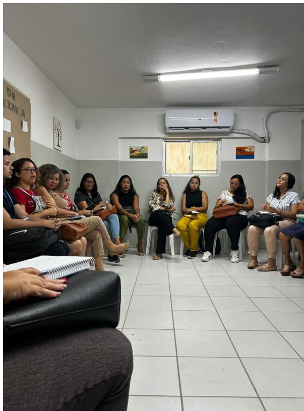
REUNIÃO DE REDE EM SAÚDE MENTAL