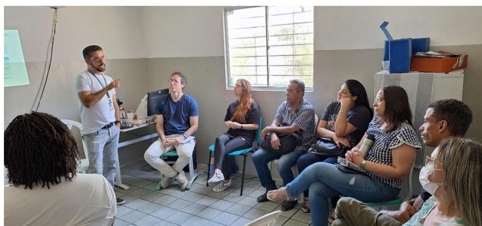
REUNIÃO DE REDE